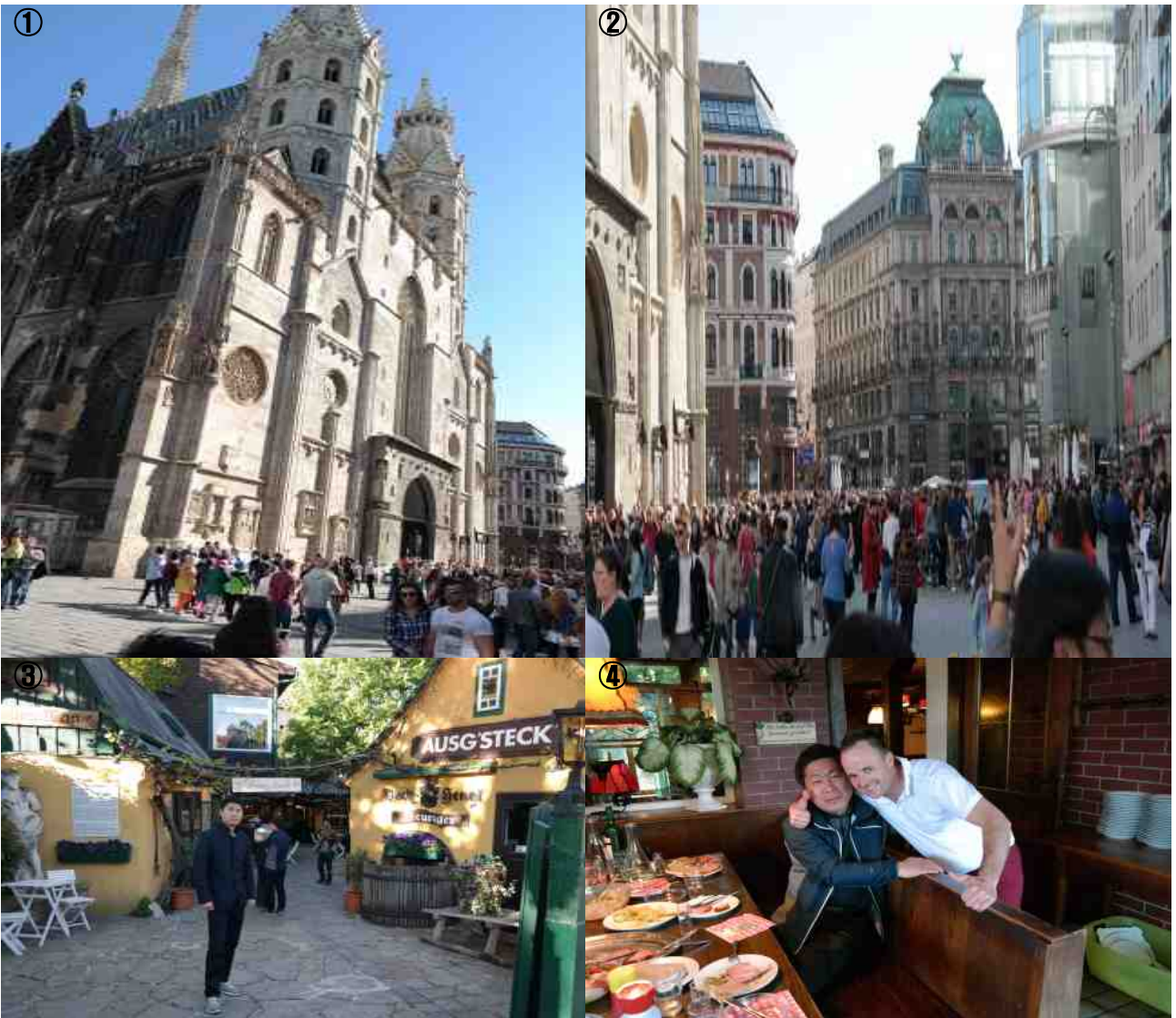
①: 슈테판 성당(Stephan Cathedral) ②: 슈테판 앞 시가지 ③: 바흐헝글(Bach Hengl) 식당 ④: 호이리게 음식과 헨쌌한 지배인...