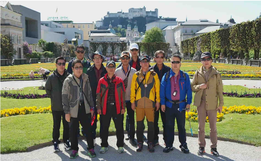
미라벨정원과 궁전(Mirabell garten)

잘츠부르크의 대표 변화가인 게트라이데 거리에서 진한 노란색 건물을 찾으면 된다. 모차르트가 1756년 1월 27일 태어난 뒤 17세까지 살던 집으로 모차르트의 생활상을 살펴볼 수 있다. 모차르트의 유년시절 작품이 탄생한 곳으로, 현재는 모차르트가 생전에 사용하던 침대, 바이올린, 피아노, 악보, 초상화, 편지 등이 전시되어 있고 박물관으로 일반에 공개되어 많은 인기를 얻는 관광명소가 되었고 이로 인해서인지 천재 음악가 모차르트가 태어나고 자란 생가가 있는 모차르트의 도시 잘츠부르크에는 음악과 함께 문화가 공기처럼 흐르는 걸 느낄 수가 있었다.