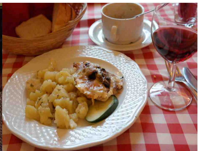
굴라쉬스프(gulyas) : 유목 민족이었던 헝가리인이 예전부터 파프리카를 이용하여 다양한 야채와 소고기를 넣고 끓인 시큼한 맛의 스프