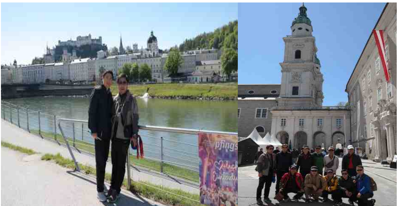
잘츠부르크성(Hohensalzburg Castle) 레지던츠광장의 대성당 (Dommuseum)이 있는데 대성당의 보물과 대주교 소장품을 전시해놓았다.

20세기 후반 제작된 청동 문 3개는 왼쪽부터 각각 믿음·사랑·희망을 상징한다고 하며 해마다 7·8월이 되면 성당 앞 광장에서 ‘잘츠부르크 음악제’가 열려 무척 붐빈다고 한다. 대성당의 입구에서 1920년 호프만스탈(Hugo von Hofmannsthal)의 희곡 <예더만(Jedermann)>을 상연한 것이 잘츠부르크 음악제의 시작이 되었으며 본래 1877년에 열렸던 모차르트제를 모태로 하고 있다. 지금도 돔 입구에서 <예더만>을 공연하는 것이 축제의 개막으로 정해져 있다고 한다. 대성당 입구 오른쪽 계단을 따라 올라가면 돔 박물관