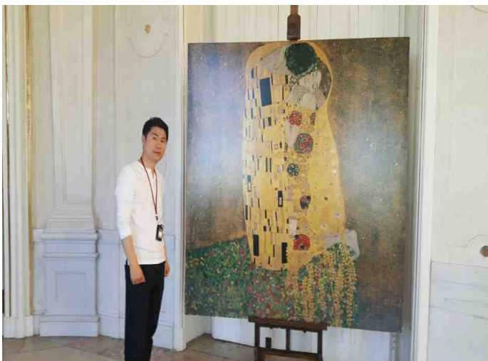
Gustav Klimt. kiss

우리일행은 외관상으로 장엄하고 간결한 형태를 띠고 있는 호프부르크 왕궁의 주변의 조망이 너무 아름다웠던 순간들을 잊을 수 없을 것 같다.