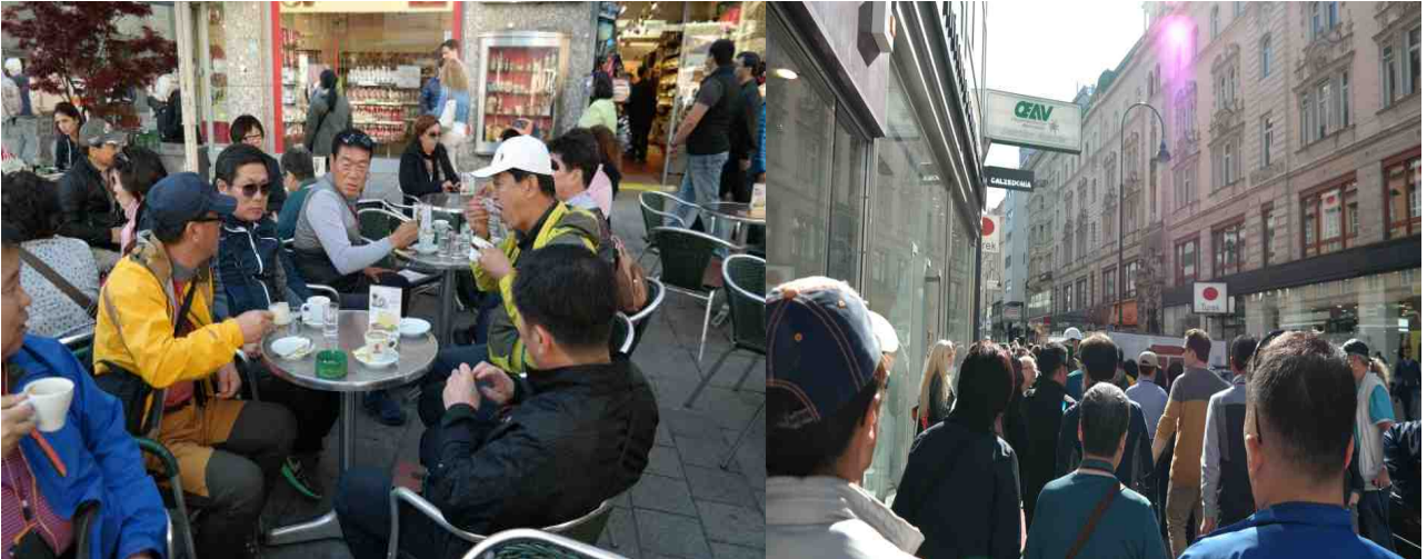
노천카페 멜란세 커피를 마시며...