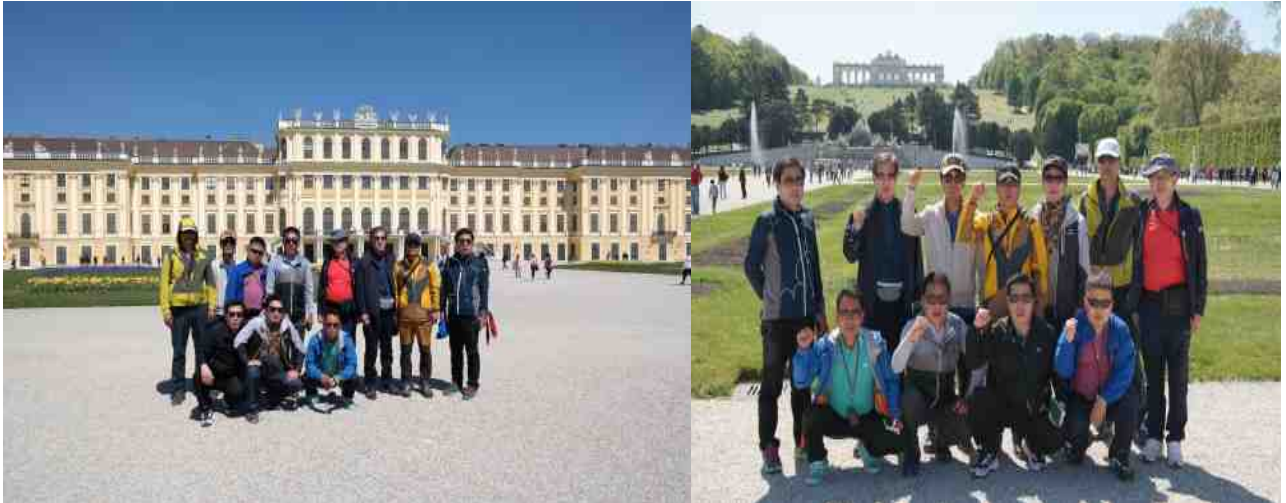
셴브룬 궁전(Schönbrunn Palace)

17세기 말엽부터 20세기 초기까지 유럽 역사에 오랫동안 영향을 미쳤던 합스부르크 왕가의 강력한 위력을 다시 한번 느끼고, 정원과 궁전은 완벽한 조화를 이루고 있으며, 여러 예술 사조가 유기적으로 연결 표현된 종합예술 개념을 보여 주는 훌륭한 예라는 것을 우리 일행은 모두 공감하였다.