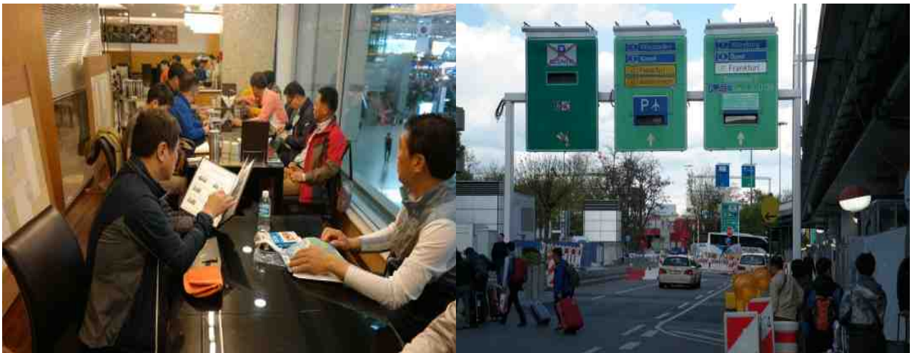
사진 1. 인천공항에서 출국전 역할분담 회의 사진 2. 프랑크푸르트 공항도착 후 이동

그러나 인천공항까지 심야버스로 이동, 12시간이 넘는 장시간 비행의 긴 여정을 거친 후 프랑크푸르트에 입성할 수 있었다(사진 1과 2).