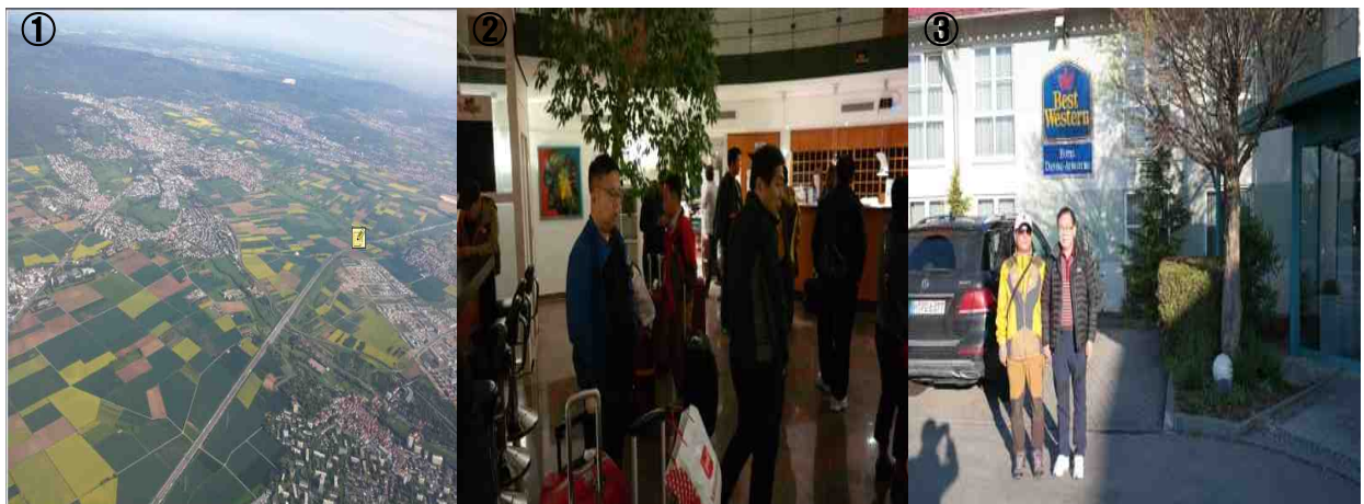
사진. ①: 유채꽃 전경, ②: 숙소 배정, ③: best western hotel dasing

이동하는 중 눈에 띄는 것은 하늘에서 바라본 많은 유채꽃들이었는데 독일은 세계 바이오디젤 생산 1위이며 독일의 많은 주유소에서는 유채꽃을 원료로 한 바이오디젤을 판매하고 있다고 한다. 아우구스부르크 DASING 호텔 숙소로 도착. 늦은 시간에 도착하여 저녁 식사는 한국에서 비상 식량으로 가지고 온 음식으로 끼니를 해결하고 각자 숙소로 돌아간 후 개인 정비 시간을 가진 후, 분임토의는 따로 하지 않고 본격적인 탐방을 위하여 휴식에 들어갔다.