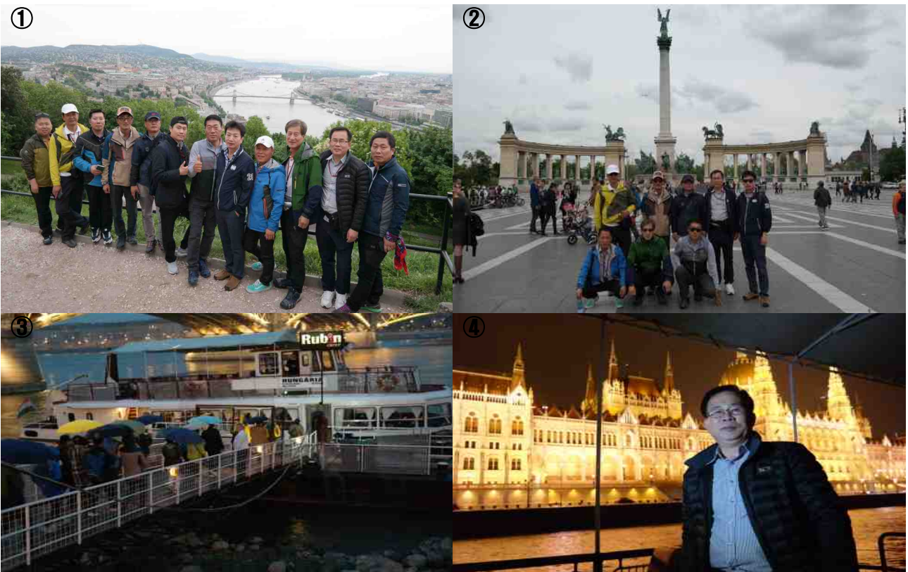
사진. ①: 다뉴브강(Danube) 전경 ②: 영웅광장(Heroes' Square) ③: 다뉴브강 야간 유람선 탑승 ④: 국회의사당(Parliament Buildings)

사실 부다페스트 하면 야경을 빼놓고 얘기를 할 수 없을 정도로 멋진 야경이 있는 도시이기에 우리 일행은 다뉴브강 양 옆으로 부다지구와 페스트 지구를 나누면서 국회의사당과 부다왕궁 등 다양한 부다페스트의 건축물의 웅장함과 진정한 부다페스트의 매력을 느낄수 있는 다뉴브강 야간 유람선을 투어했다.