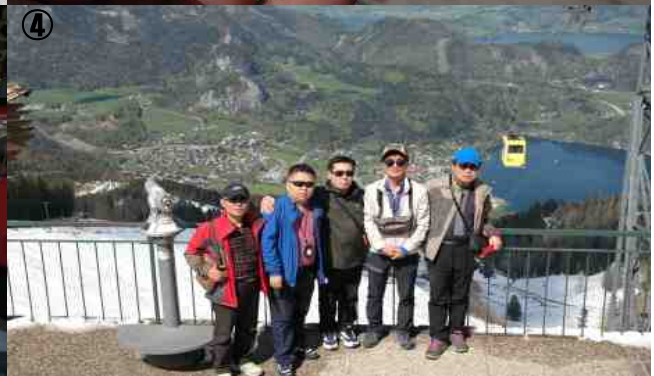
사진. 짤츠카머굿 (①: 썬벨츠호른 입구 ②: 매표 ③: 볼프강케이블카 탑승 ④: Salzkammergut 전경)